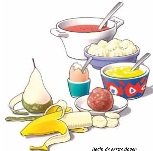
Begin de eerste dagen met zacht voedsel

Eten met uw nieuwe kunstgebit is wat onwennig. Zeker in het begin zult u voorzichtig aan doen. U ervaart zelf het beste wat wel en niet kan. Neem de eerste dagen zacht voedsel, zoals puree, gehakt en zacht fruit. Probeer enkele dagen daarna een stukje vis en een aardappel. Weer later kunt u voedsel eten zoals vlees of een appel. Stukken afbijten kunt u met een kunstgebit beter niet doen. Snijd uw voedsel daarom in stukjes en kauw rustig en gelijkmatig met uw nieuwe kunstkiezen. Neem daarbij aan beide zijden een stukje voedsel in de mond. Neem er iets meer tijd voor dan dat u gewend was.