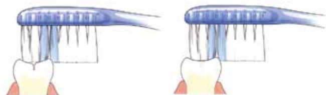
Tandenborstel komt niet in de groef

Zowel melkkiezen als blijvende kiezen hebben veel groefjes op het kauwvlak. Daarin ontstaat gemakkelijk tandplak. Niet regelmatig verwijderde tandplak kan gaatjes veroorzaken. Goed poetsen dus! Om het kauwvlak goed te beschermen, kan de tandarts een laagje 'kunsthars' (sealant) aanbrengen. Dit heet 'sealen'. Diepe groeven kan hij door het sealen afdichten. Alleen de blijvende kiezen komen hier normaal gesproken voor in aanmerking, meestal kort nadat ze helemaal zijn doorgebroken. De tandarts zal alleen sealen als hij verwacht dat er gaatjes in de groefjes ontstaan. Ook gesealde kiezen moet je goed poetsen.